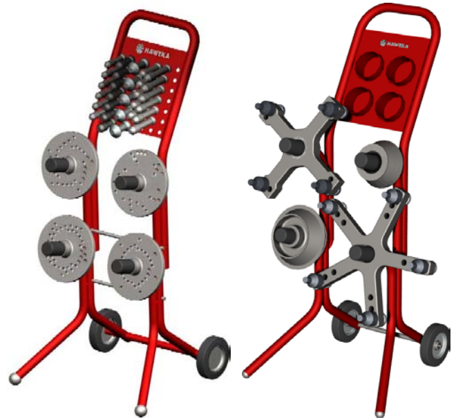
Z.B. für Pkw