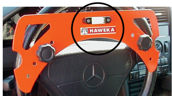
Das Positionieren des Lenkrades erfolgt über eine Libelle in der Mitte der Lenkradwasserwaage.